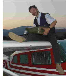
So wird im Busch getankt