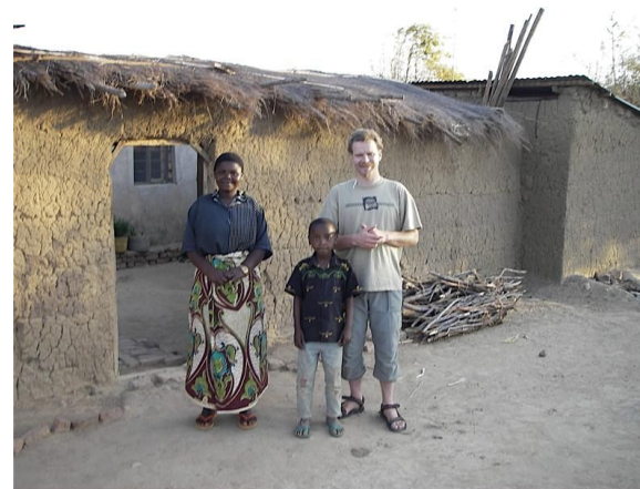
Vor dem Haus des 'Mchungaji' (Pastors)

...sende ich Dir mit nebenstehendem Bild, lieber Freund. Nicht wegen schlechter Führung, sondern als Teil meines Sprach- und Kultur-Trainings im Oktober wohnte ich 2 Tage bei dieser netten Familie, die auch noch einen Mann und drei weitere Kinder hat. Es war sehr eindrucksvoll: bereits am ersten Abend durfte ich unser Abendessen (ein Huhn) selber schlachten, die Toilette ist eine ummauerte Grube vor dem Haus, und alles